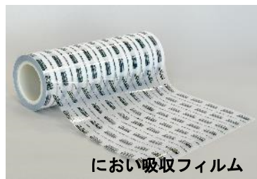
におい吸収フィルム