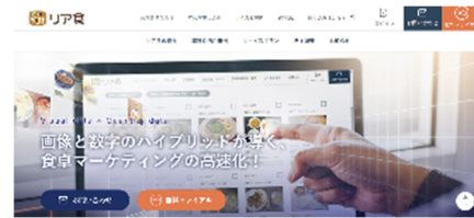
「リア食」法人向けサイト

当社は、生活者の食生活に着目したマーケティングサービス「リア食®」とフードロングライフに貢献する食品包装・容器をご紹介し、食に関わるさまざまな課題解決に貢献していきます。