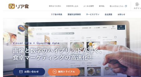
「リア食」法人向けサイト