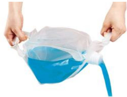
ハンディキューブ®

当社は天地に持ち手があり、安定して液体を注ぐことができる「ハンディキューブ®」を出品し、製品の利点を生かした3つの活用シーンをご提案します。内容物に応じてトータルにご相談を承りますので、ぜひ当社ブース(西1ホール W-2)へご来場ください。